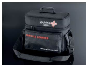
Bolsa de ombro PAMAS GO

A bolsa de ombro com ajuste personalizado oferece espaço extra para acessórios.